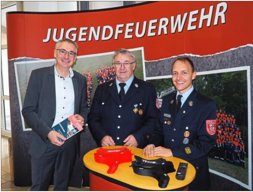
Die Landkreisfeuerwehren präsentierten sich der Jugend.