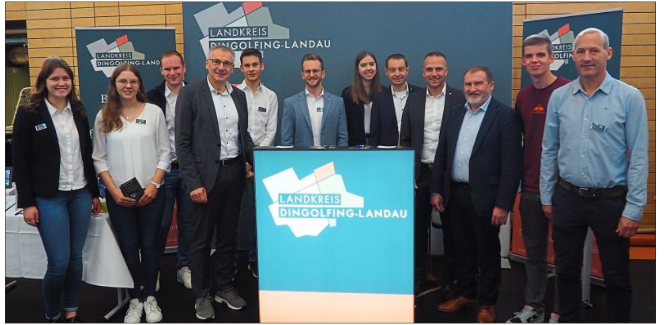
Der Landkreis war nicht nur Ausrichter der Ausbildungsmesse, sondern informierte selbst über die Möglichkeiten.