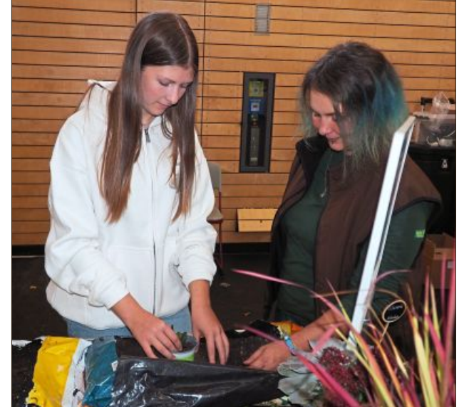
Ausprobieren war angesagt.