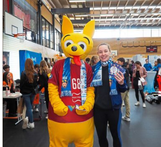
Das Maskottchen der Dingolfinger Volleyballer.