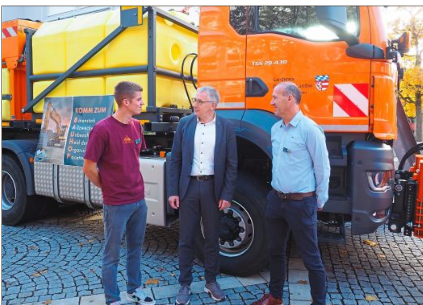
Auch der Landrat fragte nach, was täglich zu tun ist.