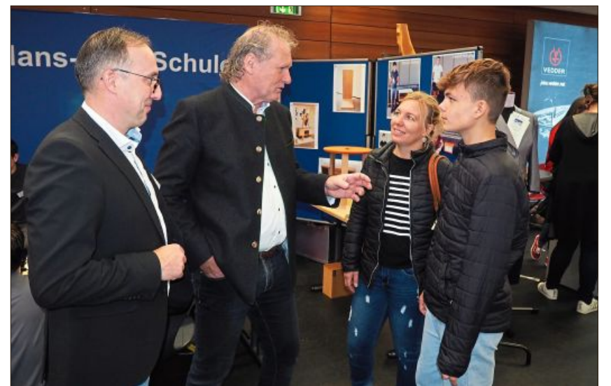
Die Fachschulen stellten sich vor.