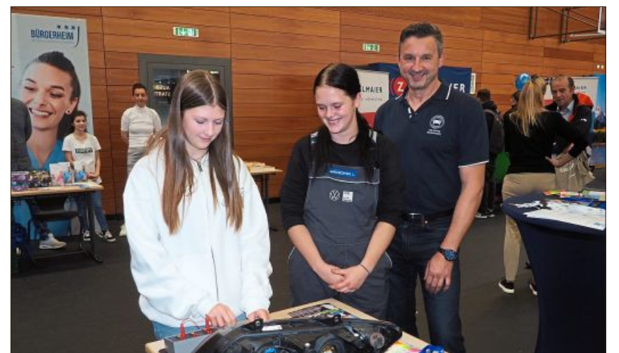
Strahlende Azubis möchten für ihren Beruf begeistern.