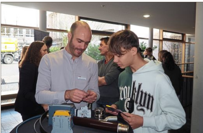
Interessiert hinterfragten die Jugendlichen die Aufgaben.