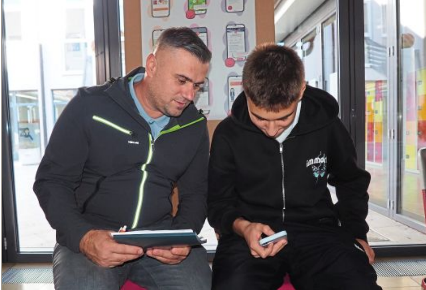
Via App wurden Vorschläge gemacht, was passen könnte.