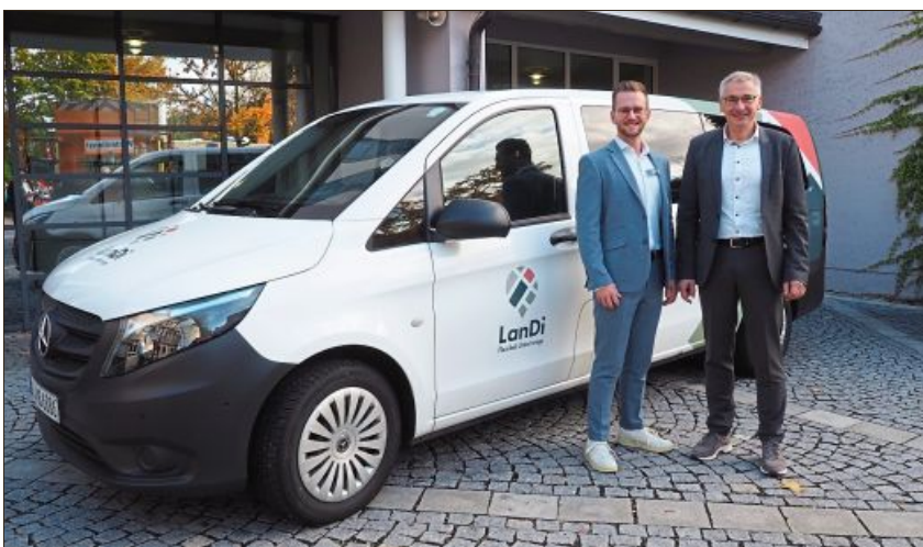
Der LanDi als Transportmittel, auch auf dem Weg zur Arbeit.